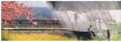
安心・安全な未来社会へ